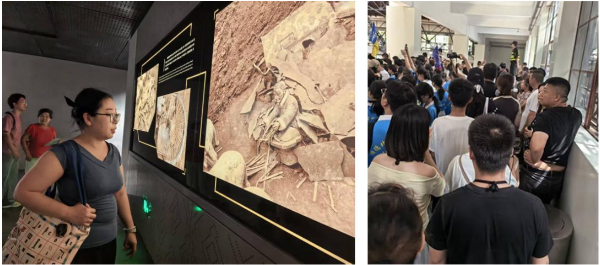
图 5 调研丽山园陵区铜车马展厅及兵马俑坑旺季游客状况