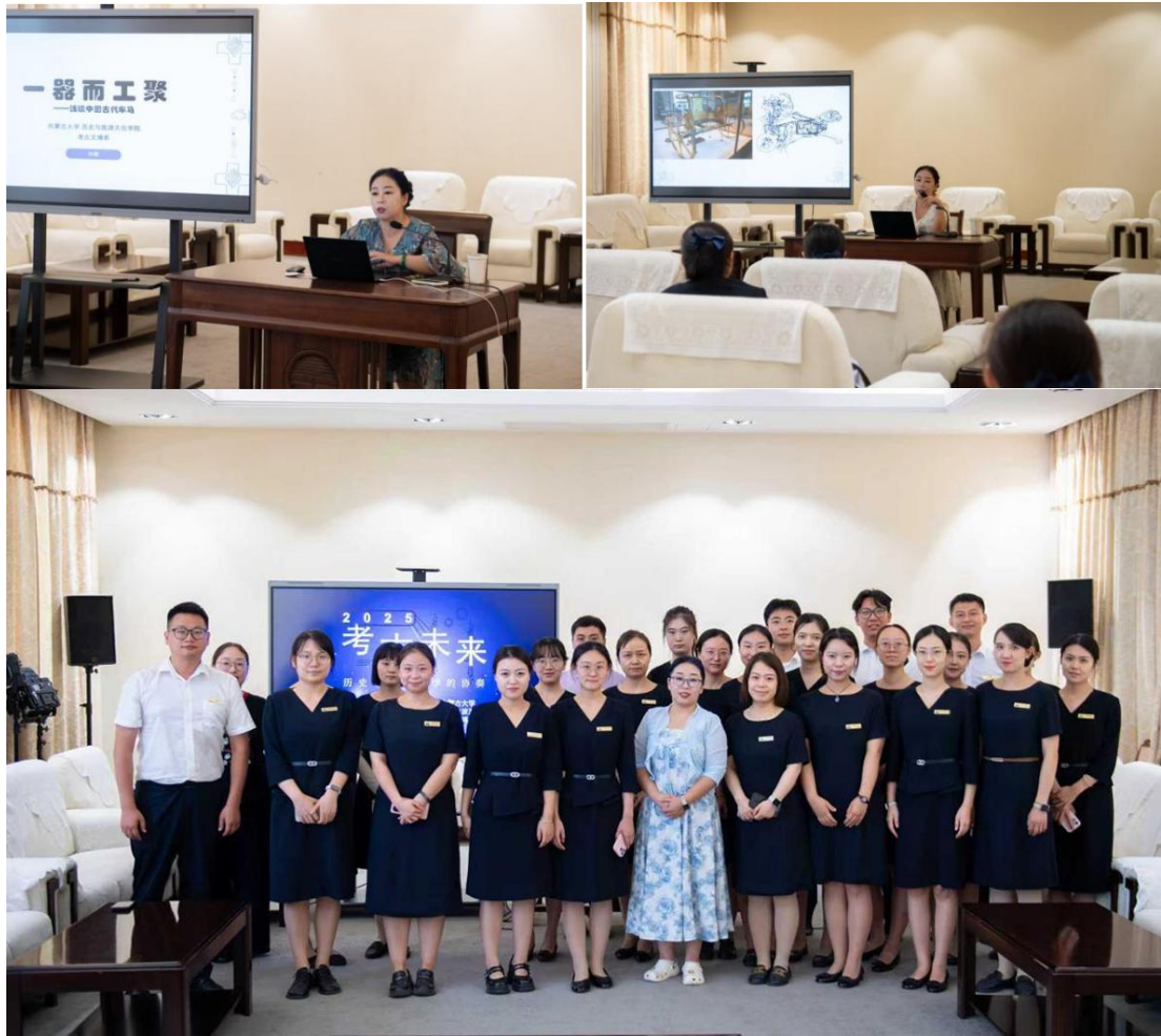
图 4 为社教部讲解员作讲座

由于帝陵博物院的兵马俑展区和丽山园陵园展区相互独立，我的日常工作区域在兵马俑展区，而讲解员的讲解区域也局限于三个俑坑内。因此，关于陈列馆的讲解内容和陵园的社教活动内容都需要单独进行考察。在社教部领导的协调安排下，这2个月我单独调研了丽山园展区3次，针对铜车马展厅中观众难以理解的内容进行详细解说，并与随行讲解员进行了深度沟通，梳理确认了原本讲解词的疏漏之处。