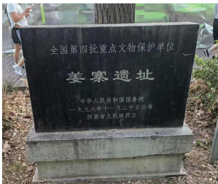
图1 姜寨遗址文保碑

2025年6月30日，我跨越一千公里从祖国北疆呼和浩特来到秦都栎阳所在的陕西省西安市临潼区，适逢雨后初霁，眼望骊山云蒸霞蔚，更深刻地理解了当年秦国择都于此的匠心独运。安顿居所时，我发现住处坐落于姜寨遗址区之上，又一次感慨陕西特别是西安地区对于考古人独特的魅力——这片土地步步是遗址、低头见文物。然而，考古人的遗憾也随之冒出来了。这个在考古教科书上无比重要的遗址，就这么安静地荒置在一个安置小区前面，没有复原展示，没有博物馆，只有铁皮围挡上贴着的几幅分辨不出颜色的介绍画，甚至文保碑都是寻找了几次才找到的。这样的场景让我感受到文化遗产资源的闲置现状，而这也是陕西等文化遗产富集地区的现实困境。