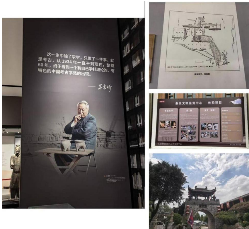
图7 陕西考古博物馆、临潼区博物馆、华清宫御汤博物馆、马嵬驿民俗村展陈情况