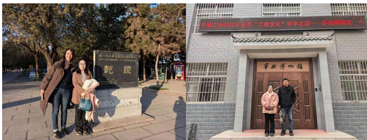
图 14 与秦始皇帝陵博物院同事调研乾陵保护区、宁县博物馆

12月1日至12月18日，我转入科研部开展访学工作，进一步深化学术研究与成果转化：12月1日，与科研部主任会谈，系统了解科研部职能与工作重点；12月3日，利用科研部信息资源，重新梳理社教部讲解内容，推动讲解词的学术严谨性提升；12月12日至12月17日，先后调研了陕西历史博物馆本馆及文物交流中心、渭南博物馆、乾陵遗址公园、懿德太子墓、永泰公主墓、章怀太子墓、周原博物馆、法门寺博物馆，并与社科院考古所西安队会谈，积累了大量文博行业调研数据；12月13日，全面了解科研部工作流程与项目管理模式；12月18日，为博物院考古部与科研部做专题报告，同时考察二号坑与东门城墙遗址，完成访学末期的学术总结与实践验证。