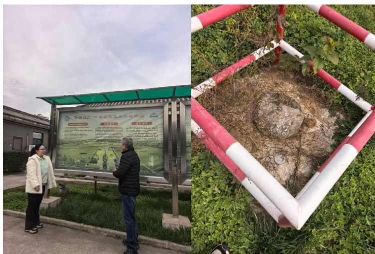
图 12 与遗产管理部主任了解帝陵管理情况、陵区内的测量基点

11月4日起，我在位于主陵区——丽山园的文化遗产管理部开展访学工作，认真研读了最新版《秦始皇陵保护规划》，并与遗产部主任深入探讨“馆陵一体化”建设中的难点问题，明确了属地政府在文旅建设中与博物院的协同问题。遗产管理部在11月的工作不是特别的紧张，我的主要任务是认真对照新的遗产保护规划，实地考察整个陵区，分析规划制定的依据、实施可能产生的效应，以及部分因地制宜的规划措施。这1个月的时间里，我用脚步丈量了整个丽山园，对秦始皇陵封土的现状、既往的发掘区域有了更为细致和具体的了解。