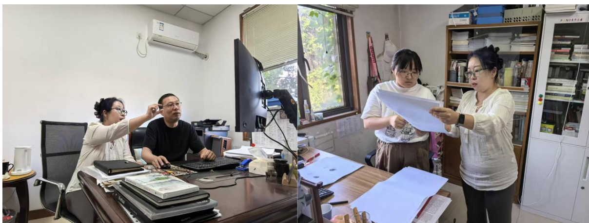
图8 与展陈部主任及同事讨论二号坑改陈方案

9月1日，我结束社教部的访学工作，转入展览陈列部，与陈列部主任开展3小时座谈，明确了部门访学期间的主要任务——配合兵马俑二号坑改陈项目工作，工作的核心目标为“提升考古现场感，增加观众互动”，同时注意流量把控。