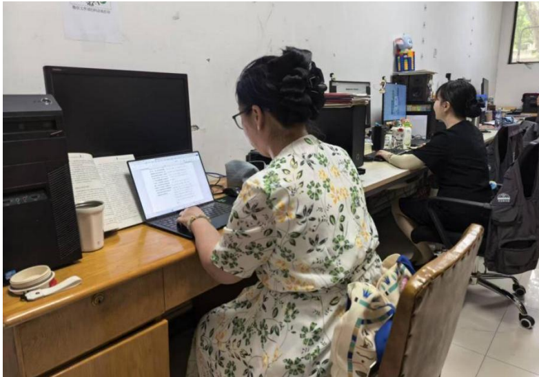
图3 为社教部翻译韩文版讲解词

我的办公地点在讲解员接待室旁边，因此在翻译工作进行的同时，我建立起“讲解员答疑常态化机制”：在早会后或讲解待命时间，为讲解员即时解答讲解过程中他们遇到的无法回答的观众问题；遇到无法直接回答的问题，帮助讲解员寻找解题思路。通过这样的交流，我不仅与讲解员们建立了良好的沟通关系，也对讲解员的日常工作与生活有了一定程度的了解。