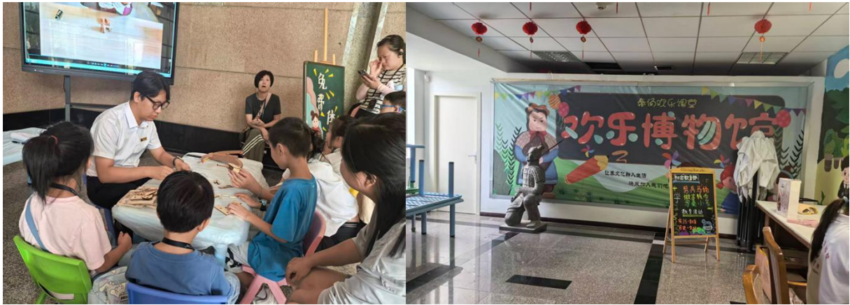
图 6 调研兵马俑社会教育活动

在社教部工作期间，我还受西北大学邀约，参与国家文物局领队班培训最终汇报点评工作。同时对博物院周边 6 处文旅设施开展专项调研，包括临潼区博物馆、华清宫御汤博物馆、陕西历史博物馆秦汉馆、陕西考古博物馆、汉阳陵博物馆、马嵬驿民俗村，重点观察各机构的社教活动设计、展陈互动形式与文旅融合场景打造情况。