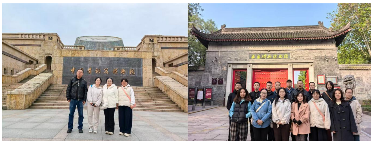
图 11 与陈列部同事调研参观中国青铜器博物馆、西安碑林博物馆

受陈列部邀请，我与部门同事共同参观了西安碑林博物馆，这是我作为支部非在岗党员，第二次参与博物院的党日活动。陈列部很快将进行与云南合作的边疆系列展，因此需要调研一些能够上展线的青铜鼎相关文物。我与陈列部同事在细致讨论已有展品后，前往宝鸡青铜博物馆开展专项调研，最终筛选出数件适合展出的青铜鼎。