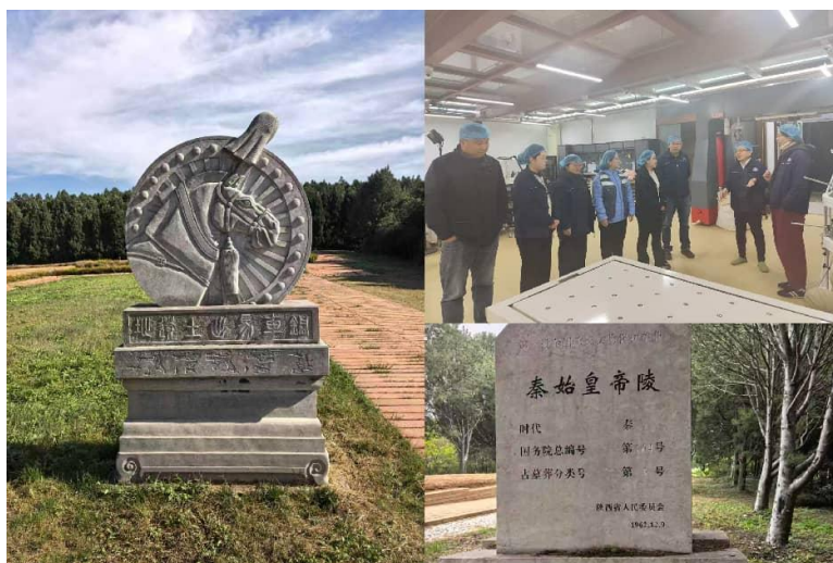
图 13 考察丽山园遗址保护情况、调研兵马俑二号坑发掘情况

11月26日，我实地考察兵马俑二号坑考古工作；11月27日，参加敦煌研究院对兵马俑三号坑的保护测试报告讨论；11月30日，考察咸阳博物馆，对比不同博物馆的文物保护与管理模式。