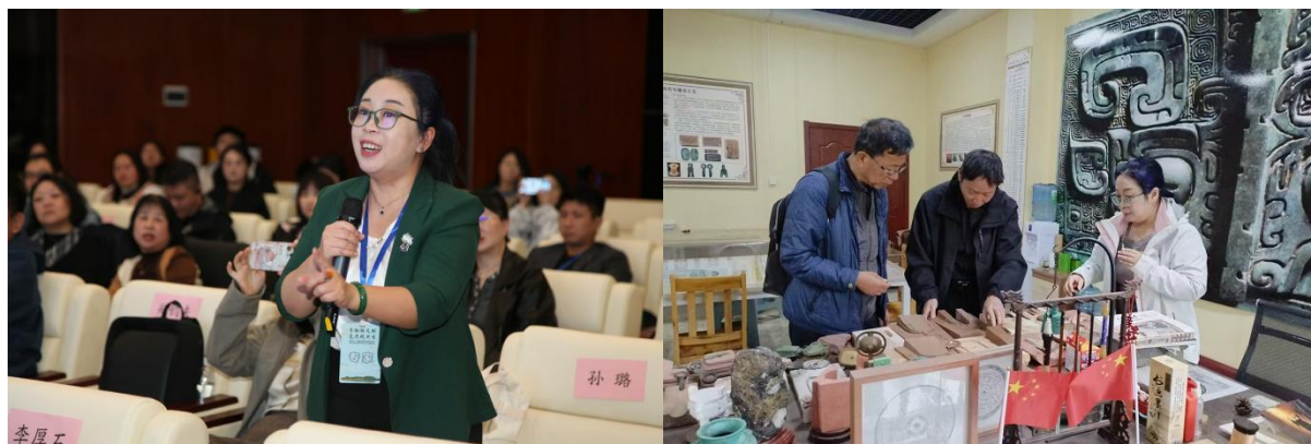
图 10 沈阳学术会议及调研青铜铸造研究所

10月的工作依然主要集中在展览陈列部，期间我受沈阳市文保中心邀请，参加了在沈阳举办的国际学术会议。会议间隙，我调研了辽宁省博物馆以及同为遗址博物馆的沈阳郑家洼子遗址展示馆，对比不同类型博物馆的运营管理模式。